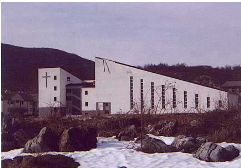
Nova crkva u Gračacu

250, a radovi se obavljaju na 45 obiteljskih kuća.