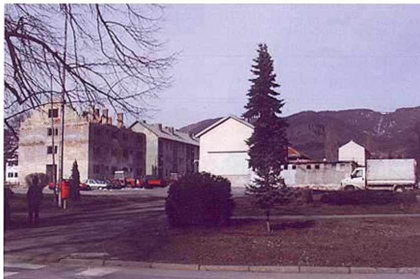
Središte Donjeg Lapca

Nešto je drukčija situacija na području gdje se o obnovi brine APZ d.d. iz Zagreba, jer je tvrtka Komgrad d.o.o. iz Donjeg Lapca uvedena u obnovu 12 obiteljskih kuća u Donjem Lapcu, Gajinama i Oraovcu. Na tom je području izdano 78 rješenja, od kojih se 11 odnosi na CARDS program, a isto se toliko sada ne može obnoviti. Najviše je rješenja izdano u Donjem Lapcu (56), ali tu se 10 ne može realizirati. Ostale kuće treba obnavljati u Birovači (5), Dobroselu i Oraovcu (4), Gajinama (3), Kestenovcu (2), a po jednu u Brezovcu Dobroselskom, Dnopolju, Gornjem Lapcu i Nebljusima. Na ovom je području snimljena 61 obiteljska kuća i izrađeno isto toliko uputa za građenje od kojih su sve revidirane.