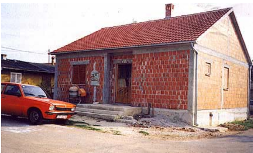
Ista kuća u Zadru na početku i na kraju obnove

Na području gdje se o obnovi obiteljskih kuća brine Idassa commerce d.o.o. iz Rijeke izdano je 109 rješenja za obnovu, a samo se 5 u Jasenicama ne može realizirati. Inače najviše je rješenja za Jasenice (38), a slijede Zadar (8), Crno i Zemunik Donji (7), Smilčić i Zaton Obrovački (5), Donji Kašić, Islam Grčki i Zemunik Donji (4), Kakma, Murvica, Novigrad i Pridraga (3), Islam Latinski, Paljuv, Rupalj i Škabrnje (2) te Donja Jagodnja, Polača, Posedarje, Prkos i Suhovare (1). Snimljeno je 68 kuća i izrađene upute za 56, jedne su prijašnje upute preuzete, a ukupno su revidirane 53.