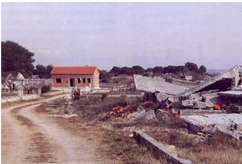
Obnovljena kuća i ruševine drugih u Crnom

Zadra, koji zaista nije imao sreće jer je čak 12 kuća sporno pa je na nekim morao i prekidati radove. Ta tvrtka inače obnavlja kuće u Jasenicama, Novigradu, Posedarju, Pridragi, Rupalju, Smilčiću, Zatonu Obrovačkom, Zemuniku Gornjem i Zemuniku Donjem. Slijedi Završnogradnja d.o.o. iz Zadra koja obnavlja 8 kuća u Crnom i u Zadru, Mušić d.o.o. iz Zadra obnavlja 6 kuća u Crnom (1 sporna), Polači, Prkosu i Škabrnji (1 sporna). U obnovi sudjeluje i Atena d.o.o. iz Gornjeg Karina koji obnavlja 5 kuća u Smilčiću, Zadru (1 sporna) i Zemuniku Gornjem.