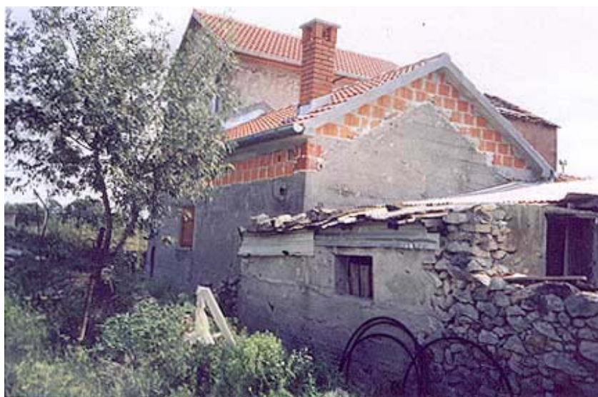
Obnovljena kuća u Zemuniku

Na području obnove pod nazivom Dalmacija obnovit će se ove godine 440 kuća te još 96 s pomoću programa CARDS. Trenutačno se obnavlja