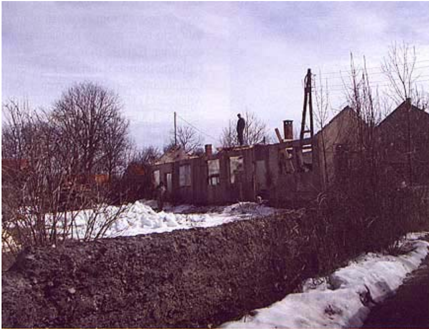
Pripreme za obnovu jedne kuće u Gračacu