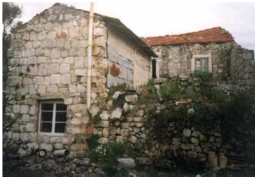
Stambena kuća koja će se obnavljati u Šipanskoj Luci

Na području Dubrovačko-neretvanske županije predviđeno je da će se