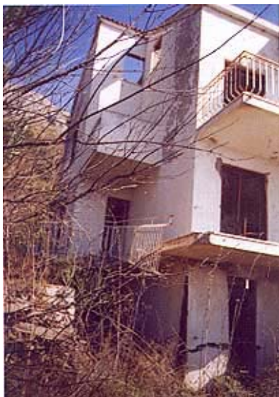
Kuća za obnovu u Mlinima

obnoviti točno 20 kuća, a izdano je 21 rješenje, od čega najviše u Dubrovniku (5) te u Čibači, Mlinima, Slanom i Zvekoviću (po 2), a u Brašini, Čelopcima, Knežici, Kuparima, Mokošici, Petrači, Popovićima i Šipanskoj Luci izdana su rješenja za obnovu po jedne obiteljske kuće. Sve su te kuće snimljene, a projekte izrađuje i nadzor će obavljati Građenica d.o.o. iz Dugopolja. Dosad je izrađeno 8 projekata, zapravo uputa za građenje, a od toga su 3 revidirane. U ovoj Županiji ima relativno mnogo rješenja (čak 11) koja se ne mogu realizirati. U tijeku je uvođenje izvoditelja u rad.